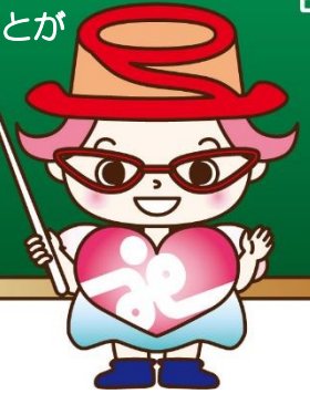
呉市社会福祉協議会 マスコットキャラクター 「クレりん」