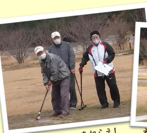
ホールインワンをねらえ!