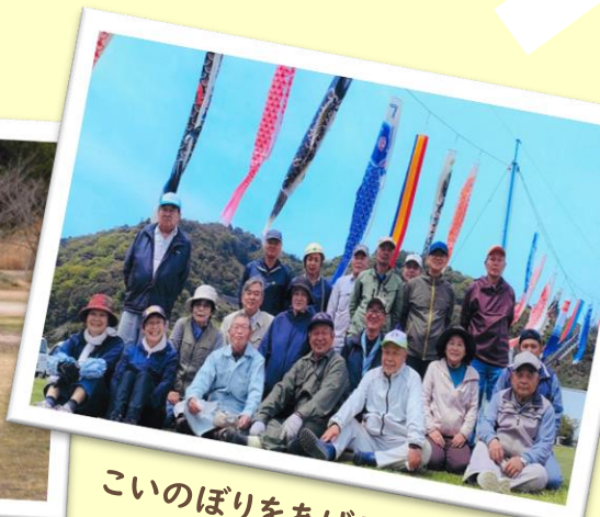
こいのぼりをあげるお手伝い