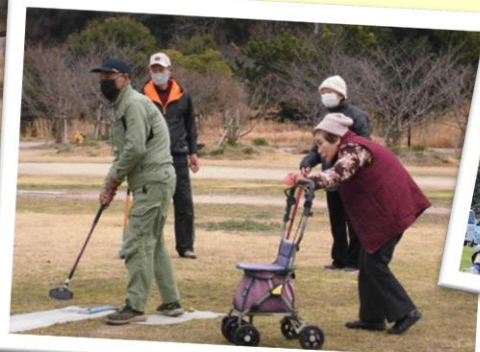
今日もよう歩いたわ~