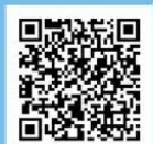
呉市社会福祉協議会 ホームページQRコード

受講案内、申込書をお送りします。ご希望の方は電話にてお申込みください。 呉市社会福祉協議会本所・支所、呉市役所・各市民センター、ハローワーク呉にて配布しています。 また、呉市社会福祉協議会のホームページからもダウンロードできます。