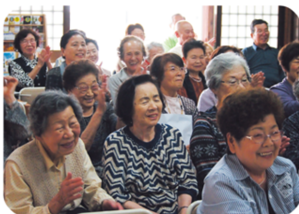
会場には大きな笑い声が溢れています