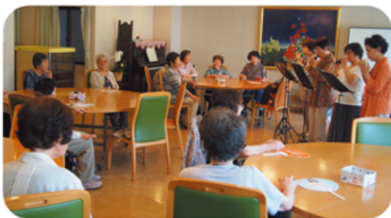
オカリナの音色にウツトリ

呉地区全体の区長の集まりで、地域ごとに高齢者の交流の場である“ふれあい・いきいきサロン”を作ろうという提案を受けて立ち上げました。