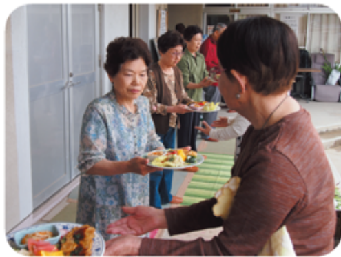
料理をリレー形式でリズム良く運びます

これまでは「年齢や地域を問わずみんな寄っといで」と門戸を大きく広げてきました。今は「顔が見える交流がしたい。サロンに来られなくなってもつながっていく関係をつくりたい」と、団地の住人を中心に掲示板や回覧板などで参加を呼びかけています。