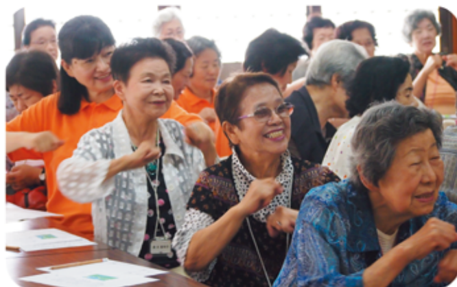
手話で「ふるさと」を歌っています

それぞれが役割分担し、負荷の偏りをなくすことが、長続きの秘訣だと実感しています。