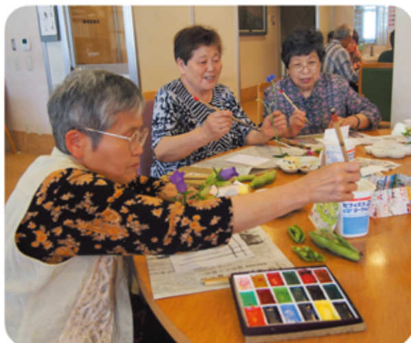
絵手紙に熱中している参加者たち

今年度は、今までの参加者が高齢になり参加が難しくなって人数が減っています。中央地域のため、各家に訪問しても、サロン開催のチラシを受け取ってもらえないことがあります。新規の参加者を募るのが難しいです。