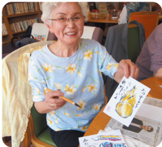
家で絵手紙の練習をしてきました