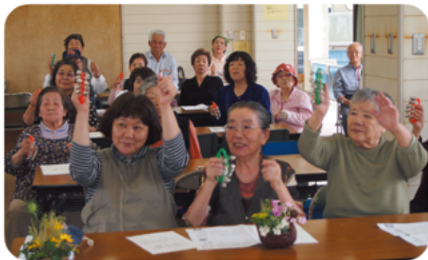
音楽療法で脳の活性化。笑顔もこぼれます

「やっぱり気の合う仲間とおしゃべり。家では笑うことが少ないからね」。宿題の川柳にも「さくらの家 みんなに会えて 元気づく」「さくらの日 目覚ましよりも 先に起き」「さくらの家 冗談言い合い 大笑い」など参加者の楽しみな気持ちが詠まれています。