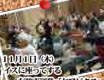
11月1日 (木) イスに座ってする 有酸素運動「ケアピクス」