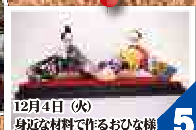
12月4日 (火) 身近な材料で作るおひな様 「手工芸」