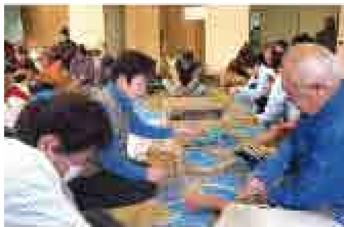
真剣なまなざしで「しめ縄」づくりに挑戦！！