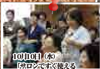
10月10日 (水) 「サロンですぐ使える レクリエーション活動」