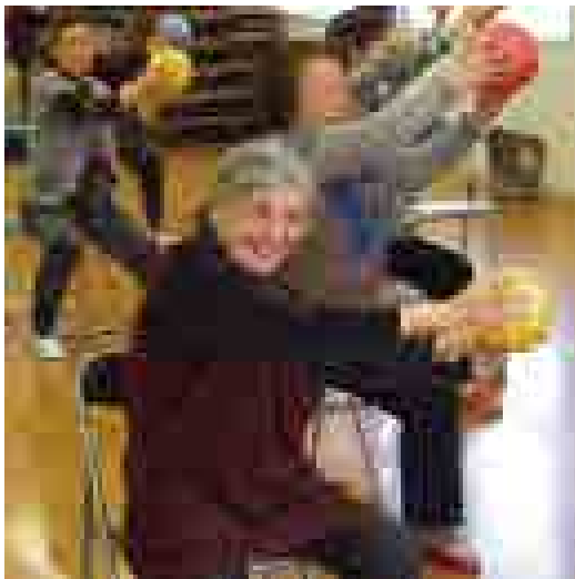
やわらかいボールを使って楽しく体操

月に2回、体操の先生にきてもらい、椅子に座ったままでできるリズム体操などを教えてもらっています。クリスマス会や新年会には、くじ引きをしてプレゼント（世話人の手作り小物）をもらいます。