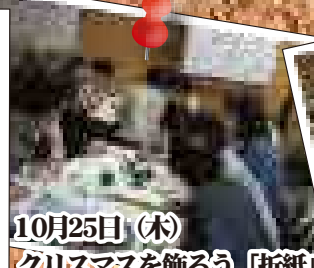
10月25日 (木) クリスマス飾ろう「折紙」