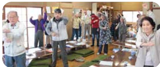
サロンの締めは、みんなで歩一歩体操