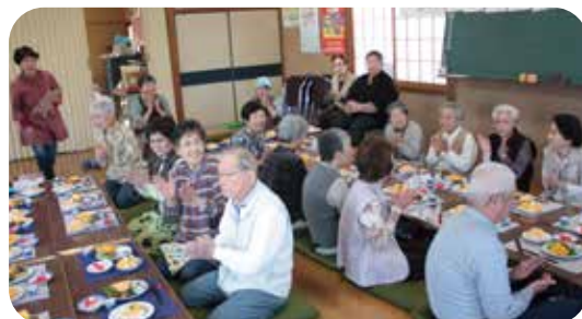
持ち寄った材料を、参加者の知恵でごちそうに。

サロンもやっと1年経過し、まだまだ、ひよこのヨチヨチ歩きです。参加者からは「ご近所で話して話す機会が少なくなってきたけれど、サロンに集まって話しが出来るので、楽しみです。」との声も。