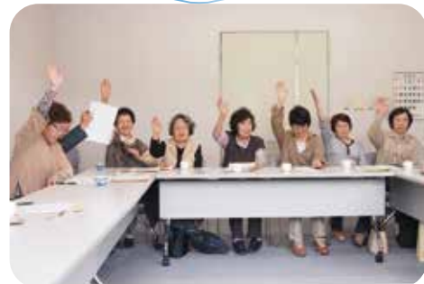
川尻地区のサロン世話人会の様子