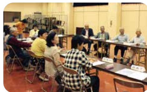
倉橋地区のサロン世話人会の様子