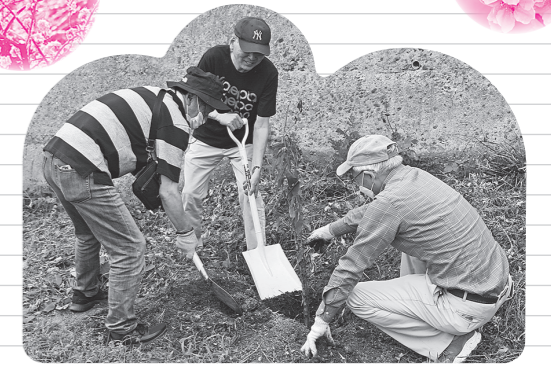
第6地区社会福祉協議会