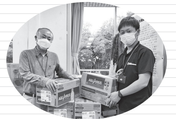
静岡県災害ボランティア本部・情報センター