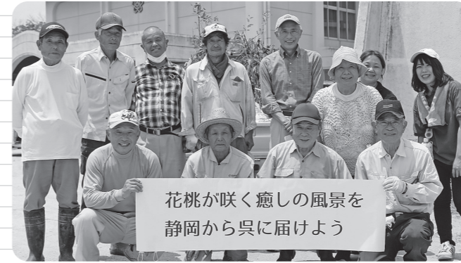
安浦地区女子畑自治会

呉市では、西日本豪雨災害（平成30年7月）に見舞われた際、全国各地から様々な支援を受けました。特に、静岡県の皆様には発災直後から6カ月間にわたり、災害ボランティアセンターの運営や市民への物資の提供等、多大なるお力添えをいただきました。本年6月には、我がまちの復興支援として100本以上の‘はなもも’の苗木をいただき、一緒に植樹をいたしました。