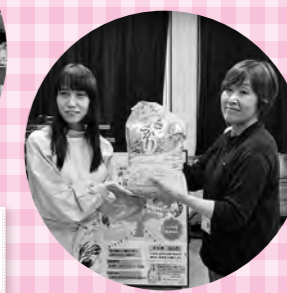
安浦町子ども育成プロジェクト 地域協働総合文化本部