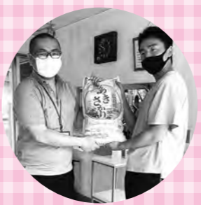
児童養護施設 救世軍 豊浜学寮