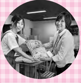
子ども食堂@豆十茶屋 NPO地域ネットくれんど

令和5年5月に、沖縄県宮古島市を拠点に慈善活動されているメテオールカラー様からお米代のご寄贈をいただきました。当法人様の希望により、呉市内で子どもにまつわる活動や支援をされている団体・施設等にお米の寄付をさせていただきました。