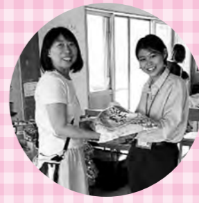
子どもの居場所づくり 大田笑会