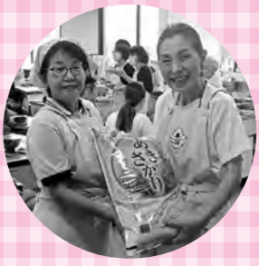
子ども食堂 むすびとみそしる