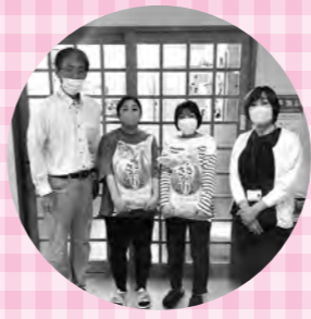
児童養護施設 呉同済義会 仁風園