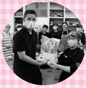
地域食堂 つなごう@天応