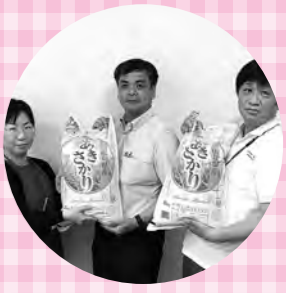
児童養護施設 救世軍 愛光園