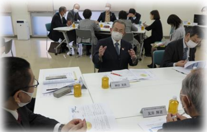
▲推進委員会の様子

呉市社協理事で構成される地域福祉部会を推進委員会に位置付け、各所属団体の立場から計画の素案に対してご意見をいただきました。