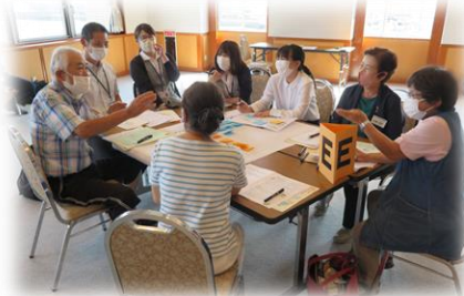
▲地域づくりフォーラムの様子▲